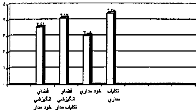
نمودار ۲ - مقایسه میانگین های جهت گیری هدفی و فضای انگیزشی ادراک شده